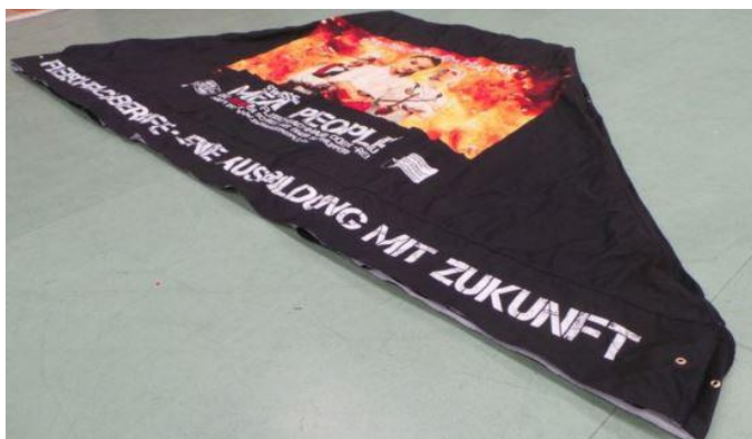
Beispiel vollflächig bedrucktes Dach 3 x 4.5 m

Sie können ein Foto optimal auf dem Dach platzieren, Bedarf Datengrösse minimum 3500 x 5000 Pixel