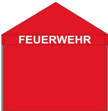
Beispiel Gut zum Druck Falzeltelt 3 x 3 m

Lieferfrist 2 - 3 Wochen ab dem unterzeichneten Gut zum Druck.