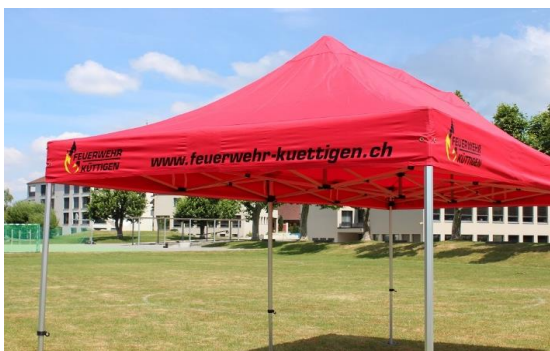
Beispiel Aufdruck des Volants