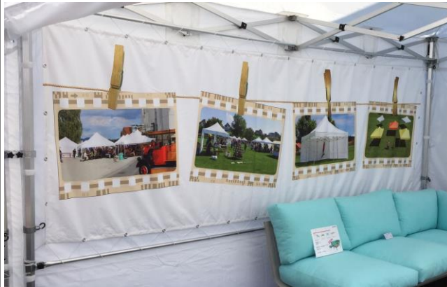
Beispiel montierte Werbebande

Lieferfrist 6 - 8 Wochen ab dem unterzeichneten Gut zum Druck