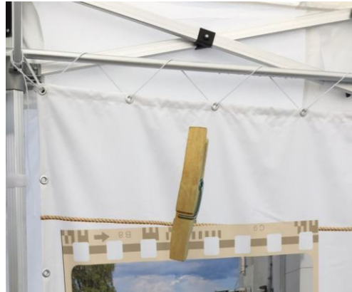
Montage mit Stange und Gummibänder

Sie können Fotos auf den Banden platzieren, Bedarf Datengrösse minimum 3500 x 5000 Pixel