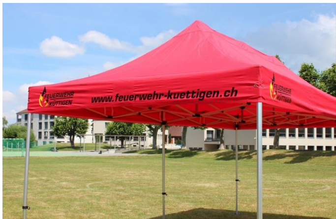
Beispiel bedrucktes Volant