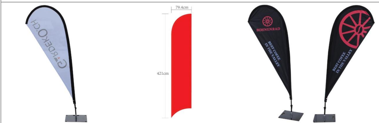
Tropfen Form einseitig bedruckt

Lieferfrist 6 - 8 Wochen ab dem unterzeichneten Gut zum Druck