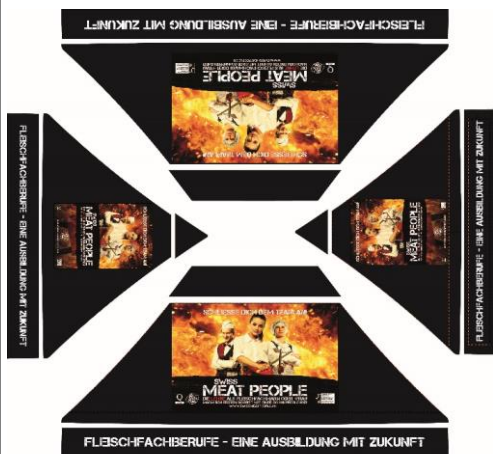
Beispiel Gut zum Druck Falzeltelt 3 x 4.5 m

Lieferfrist 6 - 8 Wochen ab dem unterzeichneten Gut zum Druck