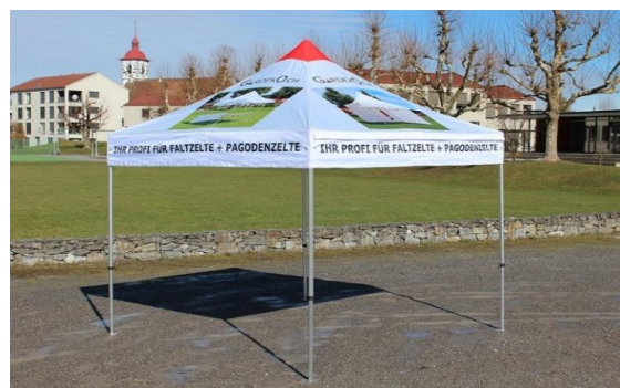
Beispiel vollflächiger Aufdruck