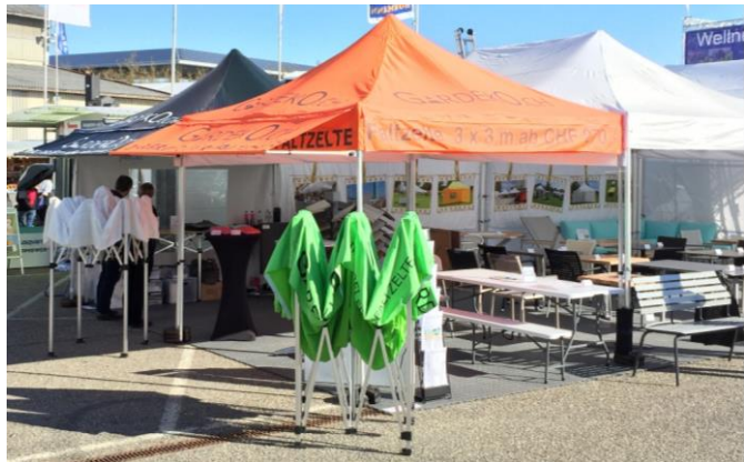
Beispiel Gut zum Druck Vordach